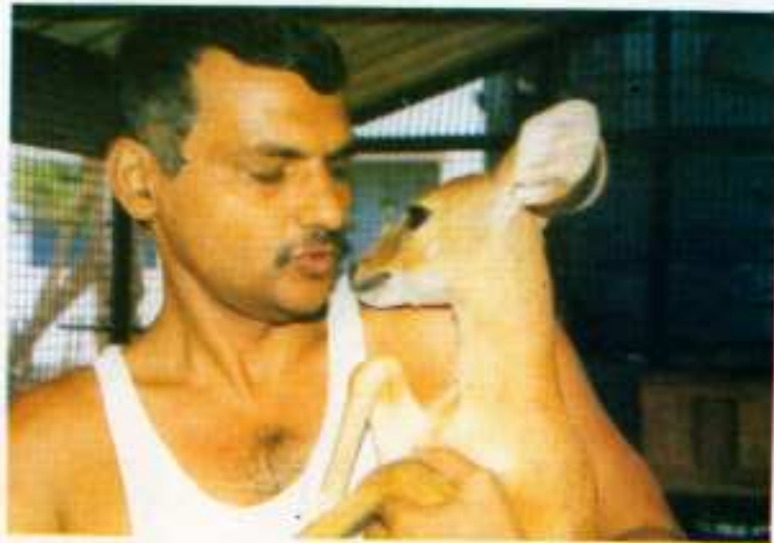
प्रकाश आमटे चीसिंगा के बच्चे के साथ।